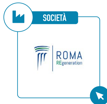
FONDAZIONE ROMA REGENERATION