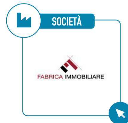
FABRICA IMMOBILIARE SGR